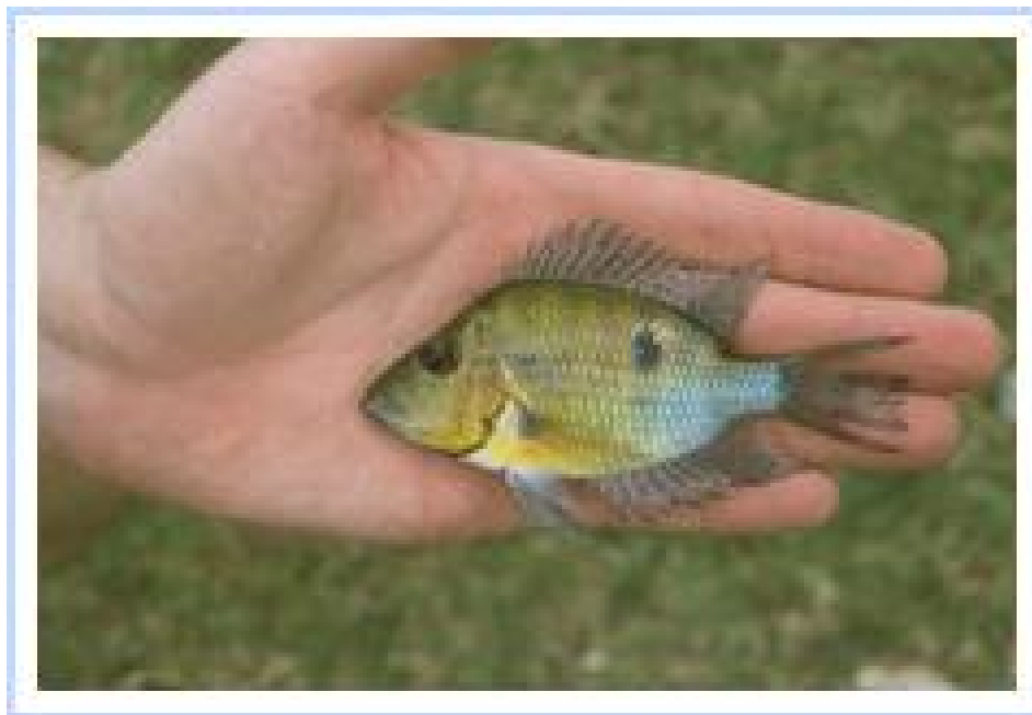
Thorichthys pasionis capture récemment du lac Noh au sud de la péninsule du Yucatán.

Thorichthys affinis le remplace comme compagnon du T. meeki. Le Thorichthys pasionis semble particulièrement apprécier les lacs par rapport aux rivières, et on le trouve en abondance dans ces eaux calmes. Les fonds meubles et boueux avec un courant de lent à nul caractérisent l'habitat du Thorichthys pasionis. Comme toutes les espèces de Thorichthys, ils habitent les parties peu profondes des rivières et des lacs, où on les y observe habituellement en groupes de tous âges. L'eau de l'habitat du meeki jaune, est normalement caractérisée par une visibilité réduite, ce qui n'étonne pas vraiment en considérant la nature des sédiments. La température y est comprise entre 25° et 30° Celsius et le pH est toujours alcalin, de 7,5 jusqu'à 8,5. Ce sont les mesures que j'ai pu prendre en plusieurs lieux de leur aire de répartition. La température de l'eau dans le milieu naturel du Thorichthys pasionis est normalement plus élevée que dans l'eau fréquentée par les espèces du groupe T. helleri. La dureté de dureté totale en degrés allemands varie régulièrement et atteint des valeurs de 8° et plus.