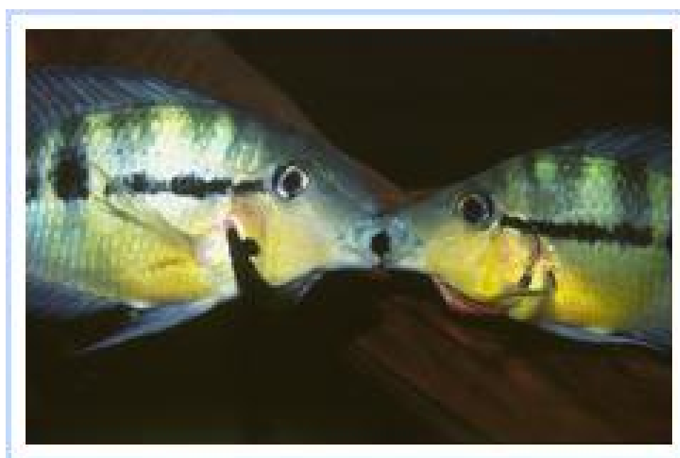
Couples de Thorichthys pasionis de la Lagune Noh dans le sud du Yucatán, défendant leur territoire en aquarium.

cousin, le Meeki, pour lequel Radeater et Ferro (1979) ont étudié ce comportement avec les même observations.