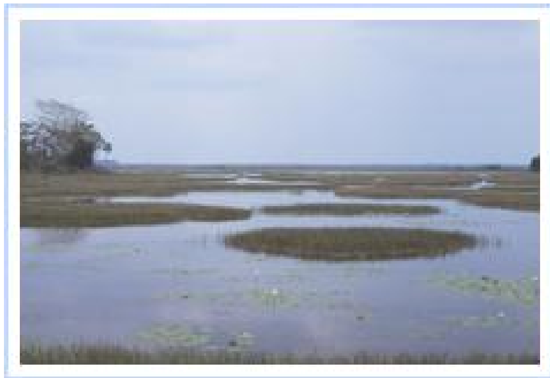
Le lac Noh dans le nord de la péninsule du Yucatán, Campeche.

Le Thorichthys pasionis est toujours retrouvé conjointement avec le Thorichthys meeki , car il habite une grande partie des habitats de celui-ci. L'aire de répartition la plus occidentale du meeki jaune est à Mexico dans les rivières et lacs dans le cours inférieur de la rivière de Grijalva autour de la ville de Villahermosa, au nord de l'embouchure du système fluvial de Grijalva-Usumacinta. La répartition du meeki jaune se prolonge vers l'Est atteignant les affluents de Rio Usumacinta dans la région de Petén au nord du Guatemala, où il semble être d'ailleurs particulièrement abondant. La répartition du T. pasionis comprend les affluents du Rio Usumacinta de San Pedro et de la Pasión.