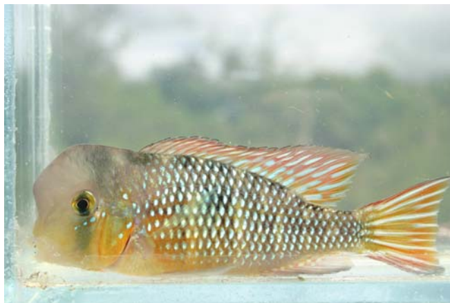
Mâle de Gymnogeophagus labiatus (Cerro Largo, Centurion)