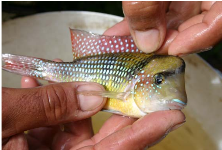
Mâle de Gymnogeophagus cf. gymnogenys (Cerro Largo, Centurion)

A Cerro Largo, les magnifiques exemplaires de Gymnogeophagus labiatus et de Crenicichla punctata nous impressionnèrent, à "33" les fabuleux et colorés Gymnogeophagus cf. gymnogenys et cf. rhabdotus . Ici à Salto ce sont les balzani qui nous émerveillent, alors que plusieurs exemplaires de crenicichla ont évidemment emporté Vinny au 7ième ciel.