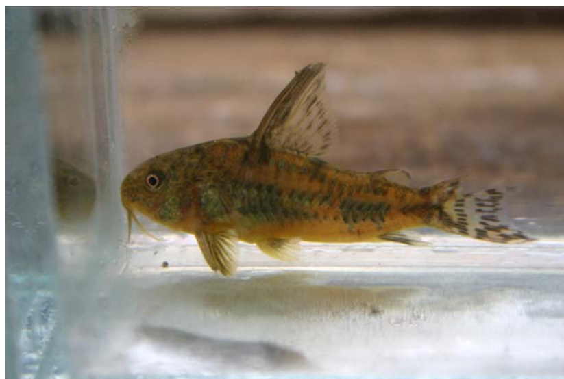
Corydoras paleatus (Arroyo de Sarandi)

Par chance, le groupe avait un intérêt commun: les cichlidés et les loricaridés et accessoirement les tétras. De plus, les 3 aquariophiles étaient très intéressés dans d'autres types de faune comme les oiseaux, les reptiles et les insectes, dans le cas où la durée du séjour nous permettra de les étudier de plus près (le groupe ne restera que 8 jours !!!), la faune est très riche en Uruguay et les possibilités de photographie sont infinies pour qui le souhaite.