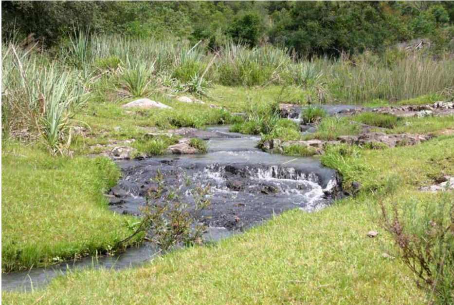
Cerro Largo, Centurion

Le temps passe et l'arrivée de Vinny et ses amis se rapproche, mais les courriels continuent de s'échanger, mon opinion étant que les visiteurs en sachent le plus possible, non seulement sur les espèces qu'ils peuvent capturer mais aussi avec le type d'environnement auquel ils seront bientôt confrontés ainsi que de la réalité du pays en général... mes quelques années de séjour en Suède m'ont donné l'impression que tous les pays d'Amérique du Sud sont mis dans le même sac et qu'il est donc essentiel de fournir au futur invité le maximum d'information possible.