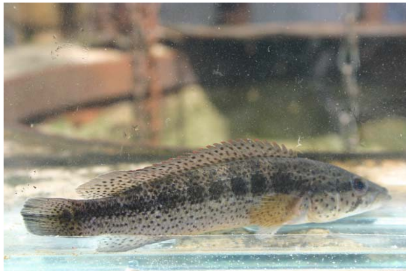
Crenicichla punctata (Cedro Largo, Centurion)

Le jour suivant, on effectue un dernier changement d'eau avant de revenir à notre « base ». Malgré le peu d'heures passées à capturer, et ce uniquement la nuit et dans un rayon de moins de 10 mètres, il fallait reconnaître que nous avons plus de poissons que je ne l'aurais espéré. Continuer la capture dans d'autres cours d'eau proches nous imposerait un choix douloureux pour choisir les espèces à emporter de celles destinées à être relâchées. La majorité d'entre elles sont des espèces nouvelles pour le groupe et il est dès lors vraiment difficile de faire la sélection. Nous décidons donc d'arrêter notre pêche et de rentrer directement à Salinas. Malgré que les 350 kilomètres qui nous séparent de Salinas soient parsemés de cours d'eau, nous les regardons s'éloigner l'un après l'autre dans un silence lourd de regrets. Arrivé à Salinas, le groupe s'aperçoit qu'il dispose déjà, et ce malgré notre décision, de plus de poissons qu'il ne pourra emporter aux Etats-Unis. Le fait qu'il s'agisse pour la plupart d'espèces nouvelles rend le choix encore plus difficile... Et il reste encore la région Nord-ouest où se trouve le centre d'intérêt principal du groupe, les Crénicichlas !